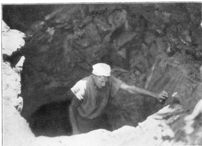
... in den man nur auf einer halbsprecherischen Leiter gelangte. (C. 216.)

Mit diesen primitiven Abbaumethoden haben einzelne Prospektoren Vermögen bis zu einer halben Million Pfund gemacht.